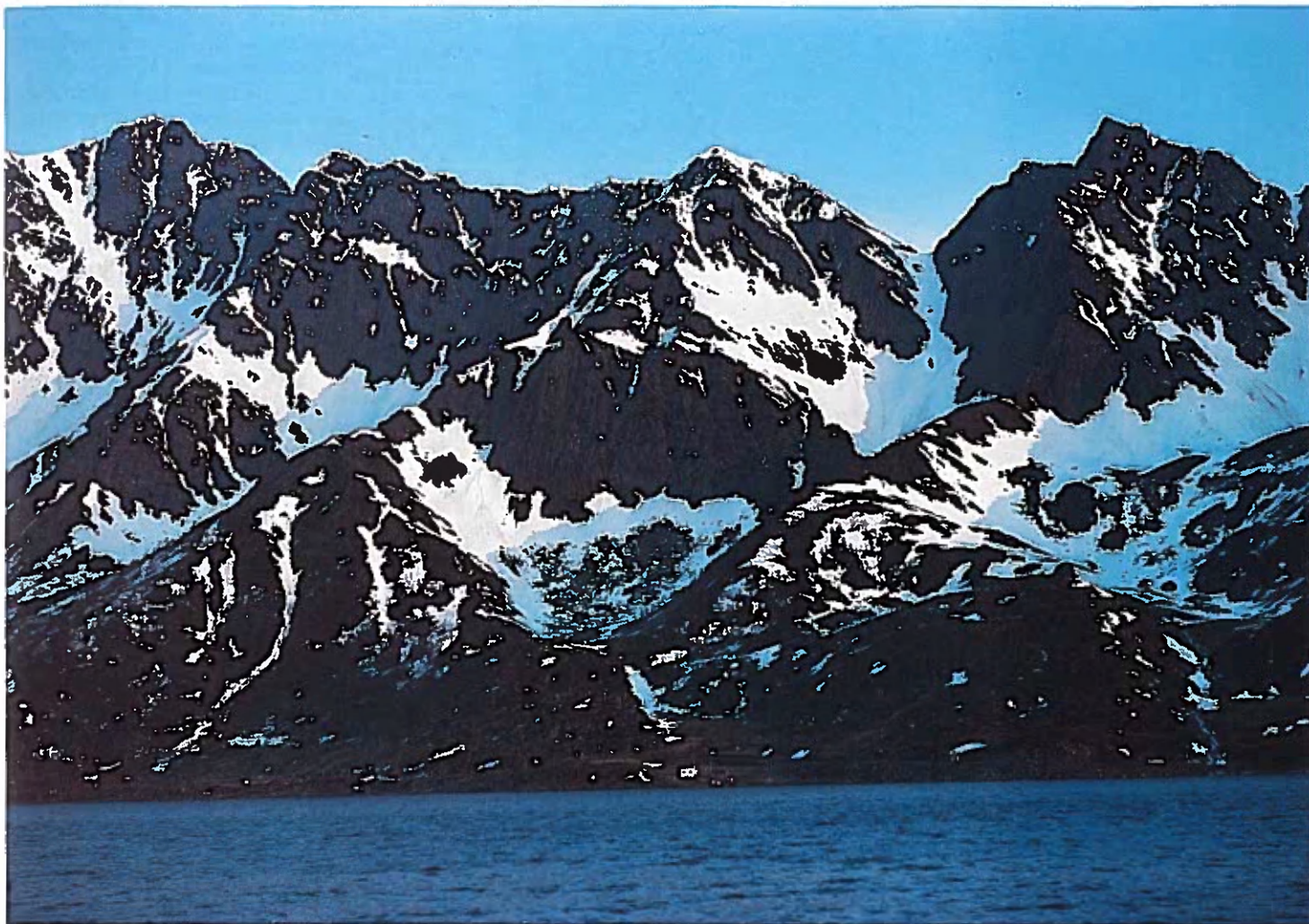
1. og 2. Svalvær, Lofoten; 3. Stallogaro, Kvalsund, 4. Hus under fjell, Nord-Norge.